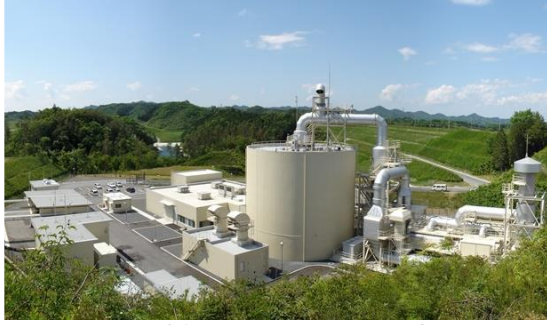
水素・燃料電池自動車の安全評価試験設備 (Hy-SEF) (Hydrogen and Fuel Cell Vehicle Safety Evaluation Facility)