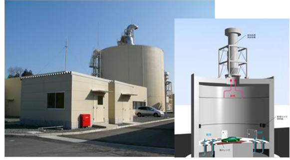
耐爆火災試験設備の3次元モデル図