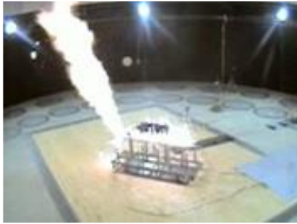
水素充填容器の火炎暴露試験