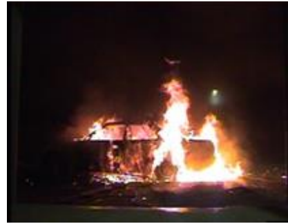
圧縮水素容器搭載車両の火災試験