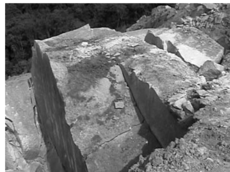
Fig. 6 The blasting result of experiment 1-4 (PS Left side).