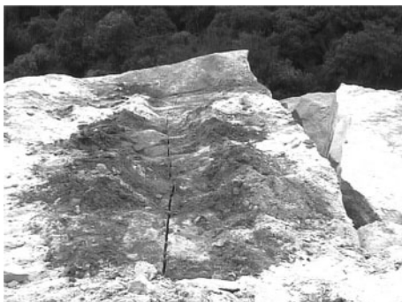
Fig. 4 The blasting result of experiment 1-2 (Demolition Agent).