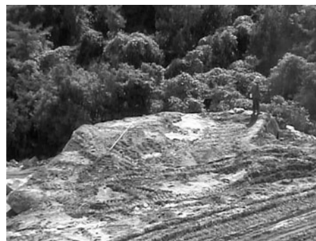
Fig. 1 View of the test site.

通常、碎石発破で使用する油圧クローラドリルを使って穿孔し、Table 1の諸元で順次一列ずつ発破した。Test 1の実験 (1.1~1.4) では (1) 薬種の違いによる影響、(2) 適正薬量の把握を目的に実施した。この実験結果からTest 2の実験 (2.1~2.2) では (3) 岩体の性質による影響を観察する為、切断方向を90度変えた。最後に発破後岩体を後方に倒して、コアを採取の上、(4) 破断面の影響調査を実施した。また、採取したコアは、破碎領域を検討するため弾性波速度の計測および含水率の計測を実施した。ボーリングコアは、PS発破面に残された穿孔跡から採取し、発破上面から3箇所採取した。採取したボーリングコアは、約5cm間隔に切断して、乾燥状態での弾性波速度を計測し