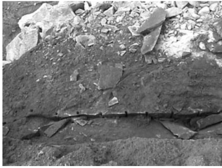
Fig. 7 The blasting result of experiment 2-1 (PS).