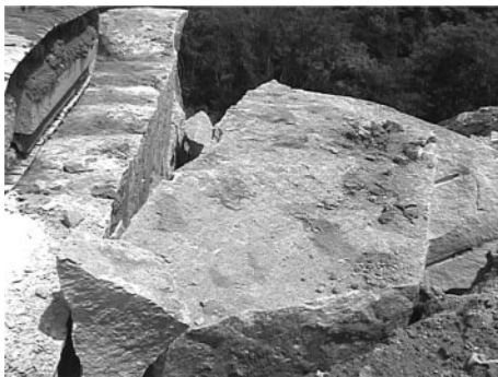
Fig. 3 The blasting result of experiment 1-1.

実験1-3の結果をFig. 5に示す。ANFO爆薬を使用した実験で、実験1-1と対称的なベンチの形で噴出ガス量も多くまだ装薬量が多いように見受けられる。残壁の状況を見ると