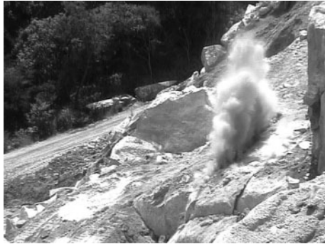
Fig. 8 The blasting result of experiment 2-2 (PS).