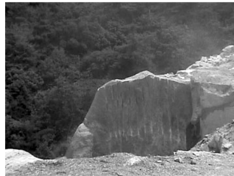
Fig. 5 The blasting result of experiment 1-3 (ANFO).